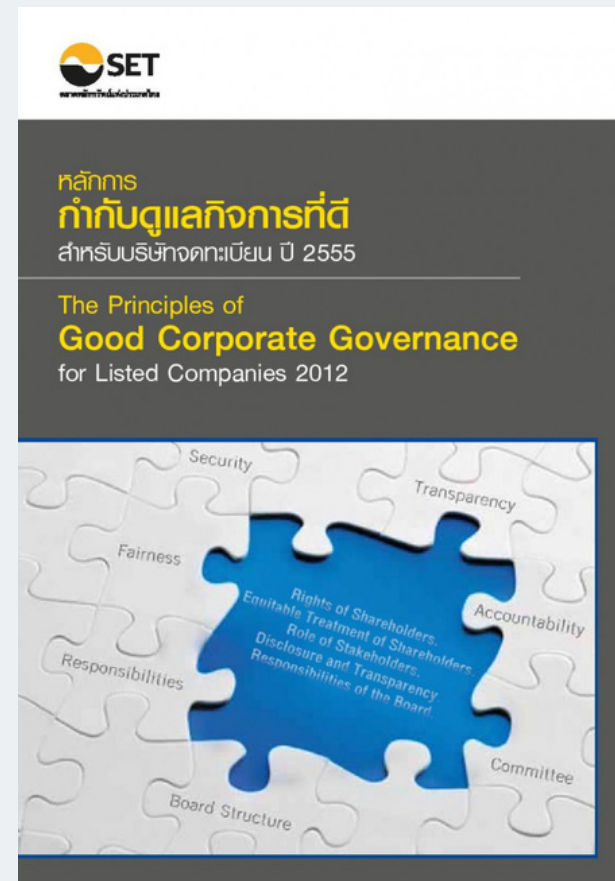
SET CG Principles