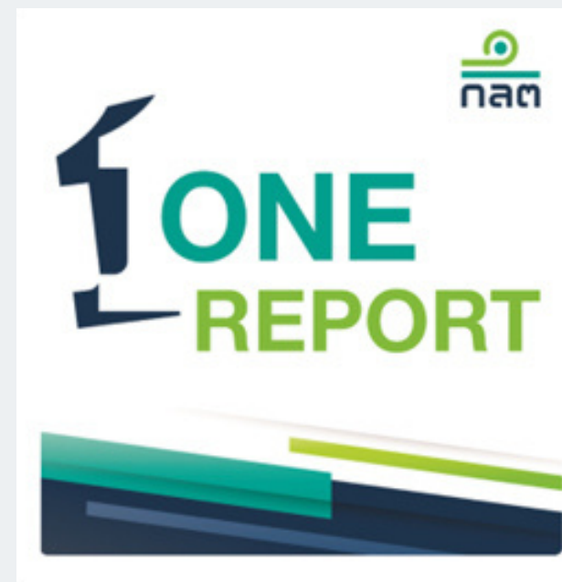
56-1 One Report