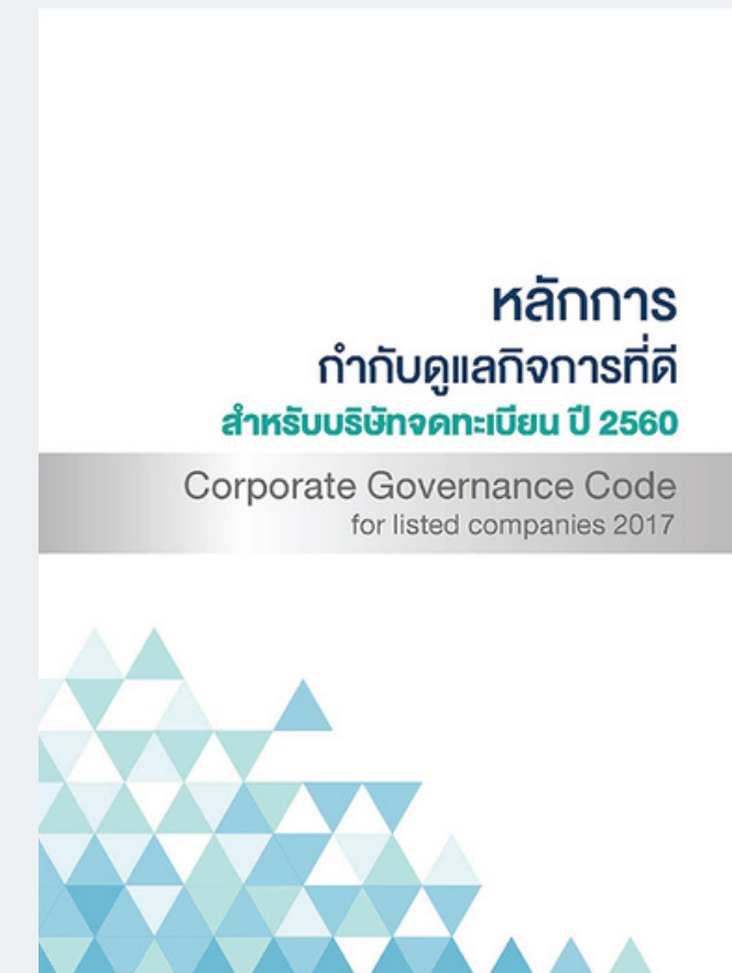
SEC CG Code