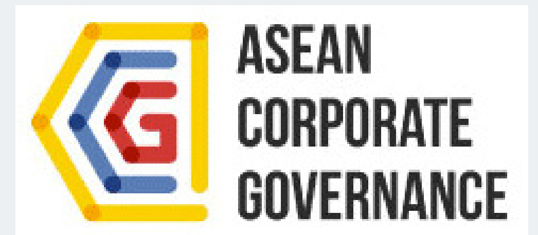
ASEAN CG Scorecard